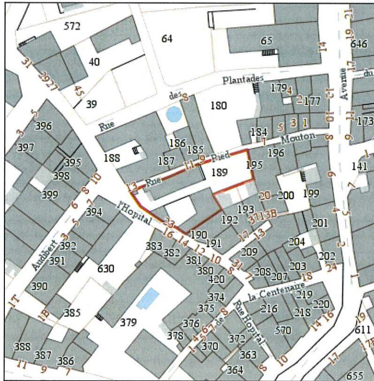
Echelle : 1/2000